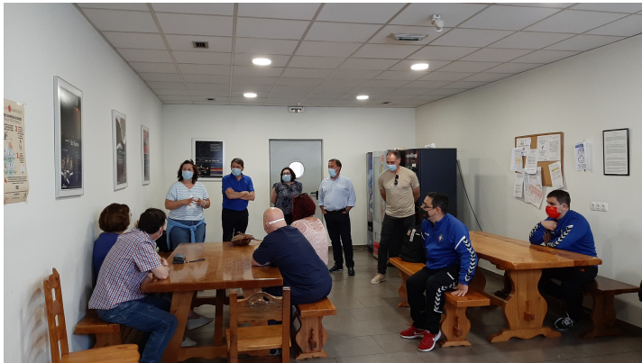
Charla de presentación del Campeonato Mi Capacidad También es el Deporte por parte de miembros de la Federación Navarra de Fútbol.

Tenemos un equipo mixto, compuesto por personas de Tasubinsa de Tudela y ADISCO con el que hemos participado y hemos quedado CAMPEONES, en esta primera edición.