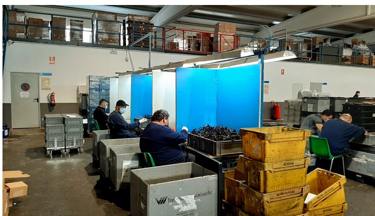
Sección de control de calidad de piezas para automoción.

Polígono Industrial Calle B, Nº 4 Apartado 59 / 31.591 Corella (Navarra)