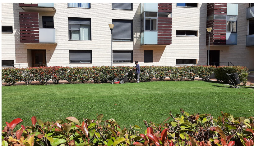
Atención del jardín de la Urbanización Residencial Paraiso de Corella.

Así, podemos resumir nuestra labor en esta sección en las siguientes actividades: