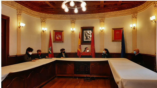
Firma del convenio Tiempo Fuera en el Ayuntamiento de Corella.

Resaltar, también en este apartado, el Convenio firmado con COCEMFE (AVANZA NAVARRA) para, a través de su servicio de integración, intentar la incorporación de laguna de nuestras personas usuarias en el empleo ordinario así como el firmado con el Departamento de Educación y Derechos Sociales del Gobierno de Navarra y el Ayuntamiento de Corella, denominado “Tiempo Fuera”, donde alumnos del IES Alhama que son expulsados, acuden, durante el tiempo que dura su expulsión del centro educativo, a realizar tareas sociales en el Centro Especial de Empleo.