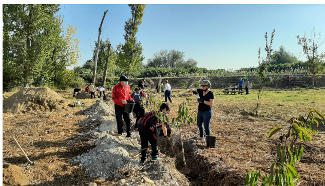
Jornada medioambiental y de convivencia con otras entidades sociales de Corella (Asociación Juvenil San Miguel y Biciclistas).

Polígono Industrial Calle B, Nº 4 Apartado 59 / 31.591 Corella (Navarra)