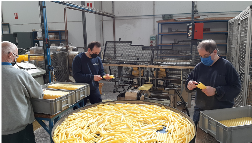
Grupo de operarios fabricando velas.

Nuestras velas se distribuyen principalmente en España a través de una red comercial con amplia experiencia en el sector del Multiproducto, es decir, en el sector de las tiendas y almacenes de “Todo un Euro”. También, aunque en menor medida, atendemos los mercados de la decoración, de la gran superficie, regalo promocional, así como a las parroquias de la zona que todavía utilizan velas para su liturgia.