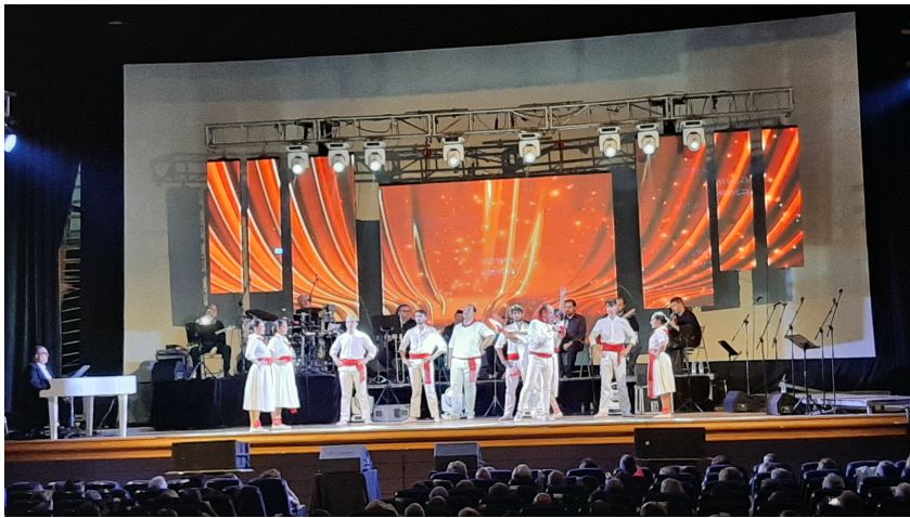
Espectáculo LA JOTA QUE YO AMÉ, llevado a cabo en el Cine de Corella.

Polígono Industrial Calle B, Nº 4 Apartado 59 / 31.591 Corella (Navarra)