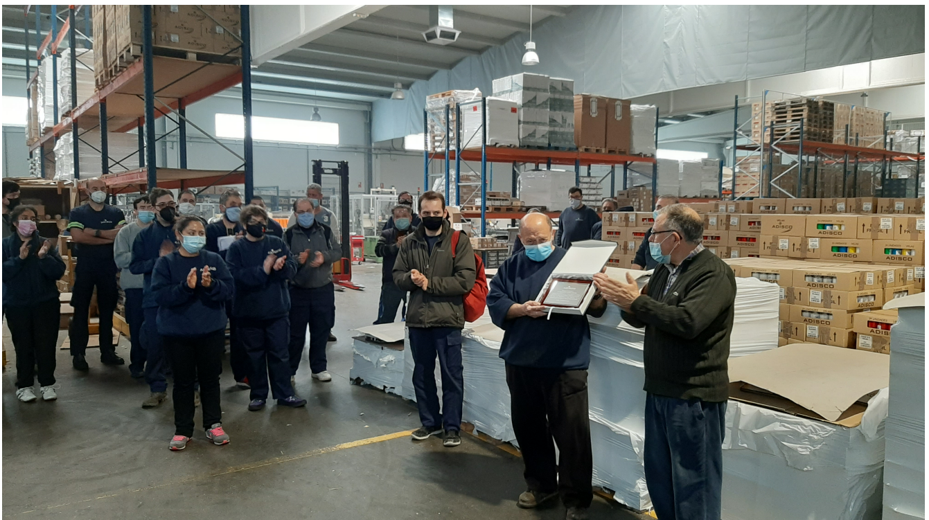
Homenaje a trabajador de ADISCO que pasa a situación de JUBILADO.